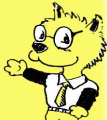
大阪労働局需給調整事業部 マスコットキャラクター「ハケンさん」