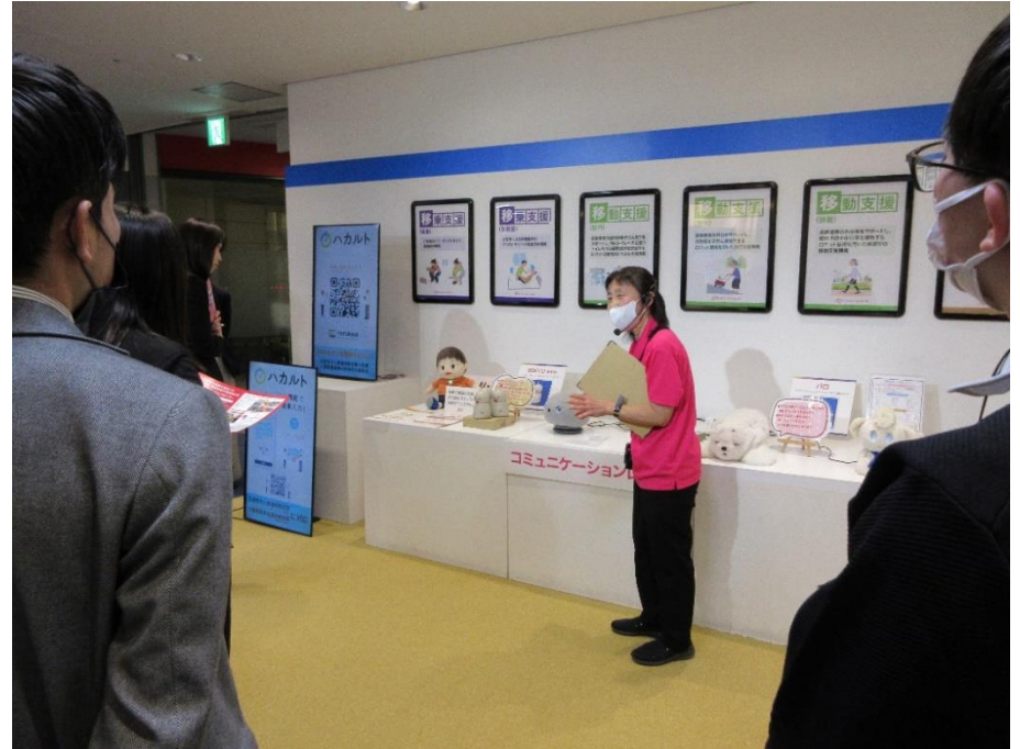
音声認識のコミュニケーションロボット等

大阪府介護生産性向上支援センターでは、ノーリフトケアをはじめとする介護テクノロジー導入のための各種支援を実施されています。