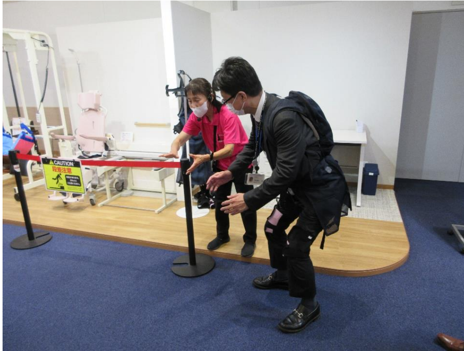
移乗支援(装着型)のパワーアシストスーツ