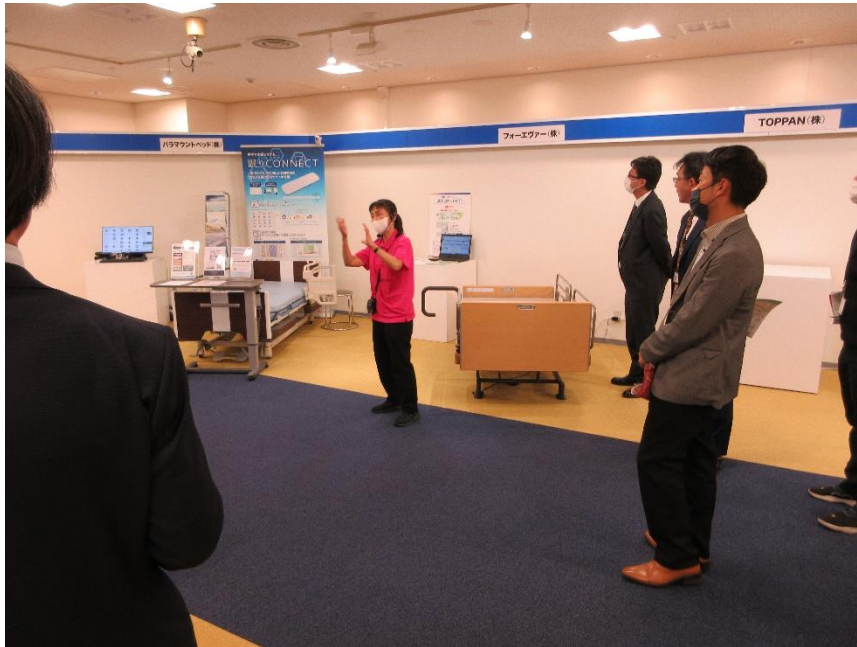
センサーが付いた見守り支援の介護用ベッド