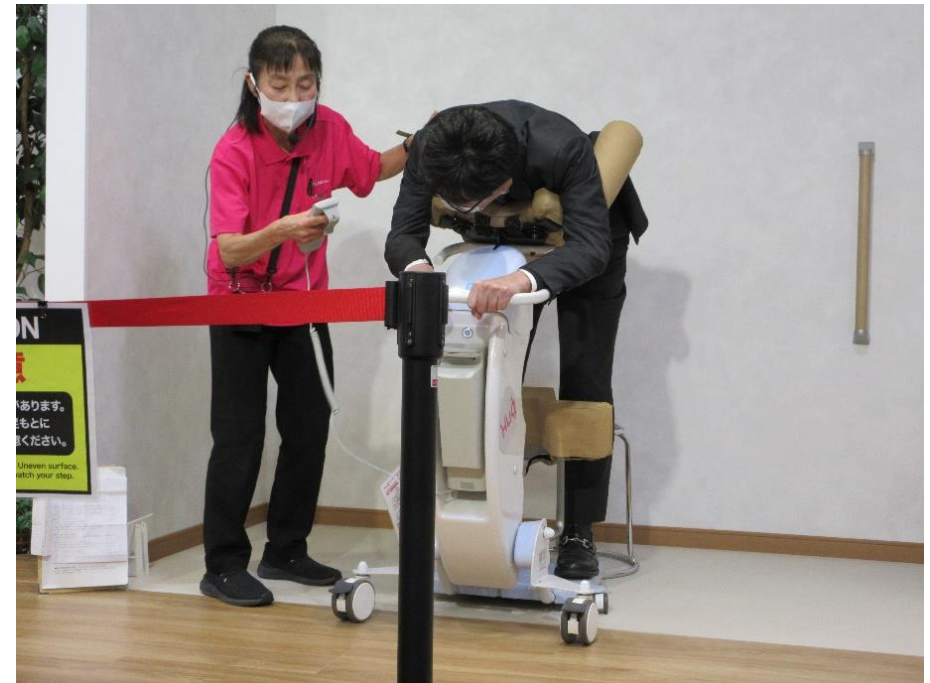
移乗サポートロボット