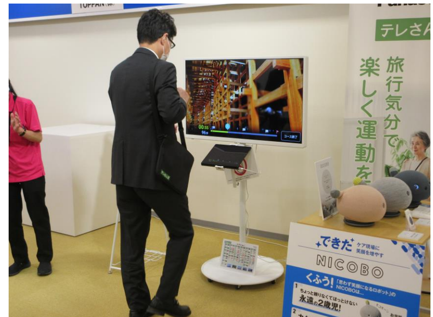
旅行気分を味わいながら足踏み運動ができる機器

展示されている各種介護テクノロジーについて解説をしていただき、体験等を行いました。