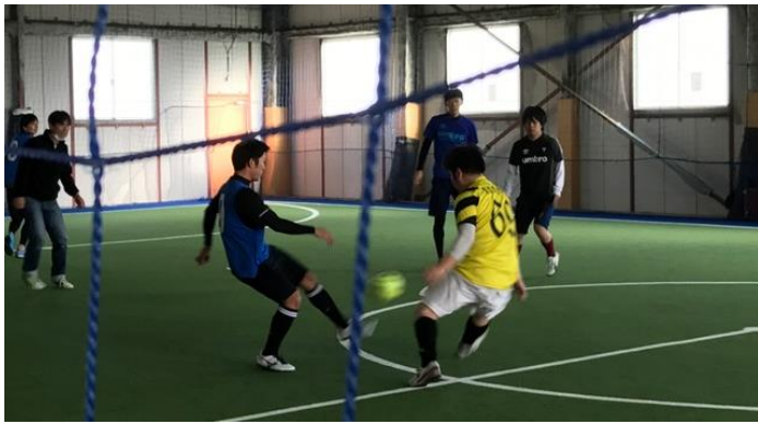
フットサル交流会 (2017年11月)