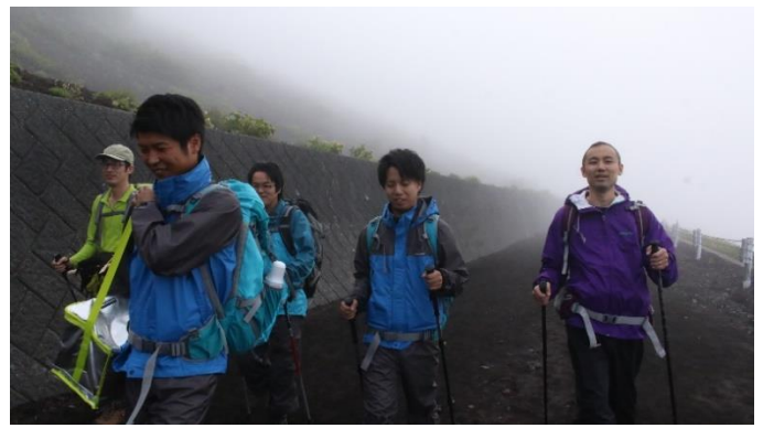
富士登山チャレンジイベント (2016年7月)