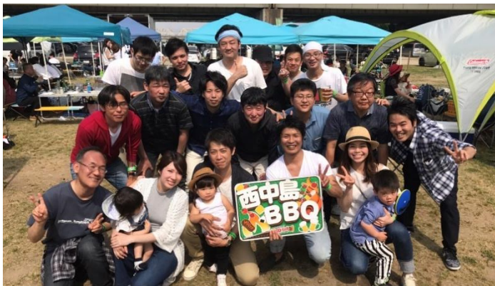
バーベキュー懇親会 (2017年5月)