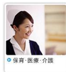
○ 保育・医療・介護