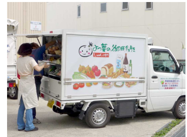
移動販売車“旬の助”

○安全・安心な食べものをご家庭にお届けする関西よつ葉連絡会のメンバーが多数で、互いに協同して活動を支え合う仲間です。