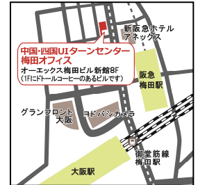
事業所へのアクセス