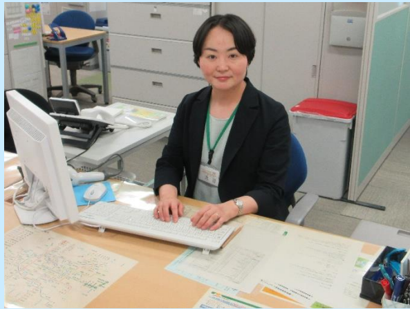
阿倍野公共職業安定所 専門援助部門 就職促進指導官