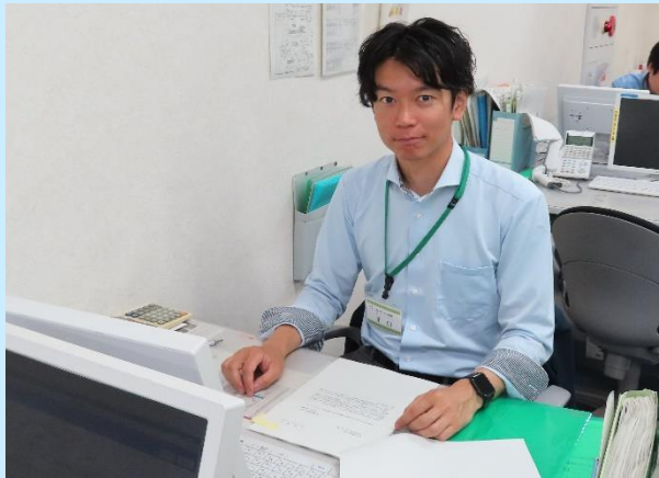
大阪東公共職業安定所 事業所サービス第1部門 上席職業指導官