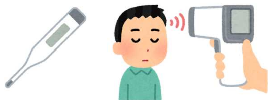
出勤前の検温・体調確認

○利用者の方の健康に配慮し、職員はマスクを着用して対応しますので、ご理解ください。