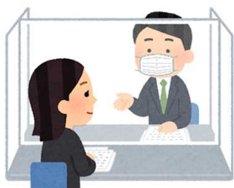
窓口に飛沫防止シート・アクリル板を設置