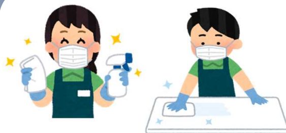
共用物品の定期的な消毒