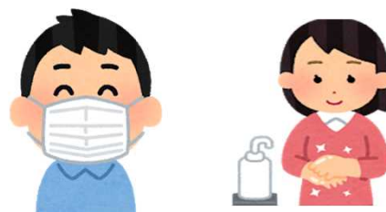
接客時のマスク着用、手指の消毒