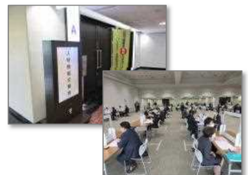
〈昨年度の会場風景〉