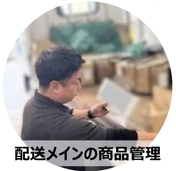
配送メインの商品管理

担当ルートのお客様への配送を担当しています。日々取引量や道路の状況が異なりますが、配送順等を考えて効率よくお届けできた時は達成感があります。多品種を扱うので覚えることも多く、慣れるまでに時間がかかりますが、先輩に聞きやすい雰囲気なので、自分のペースを作りながら安定して働けますよ。