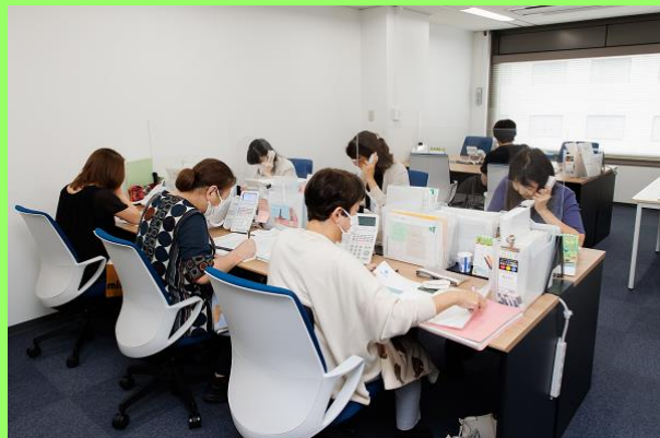
大阪メトロ肥後橋駅から徒歩3分の好立地！