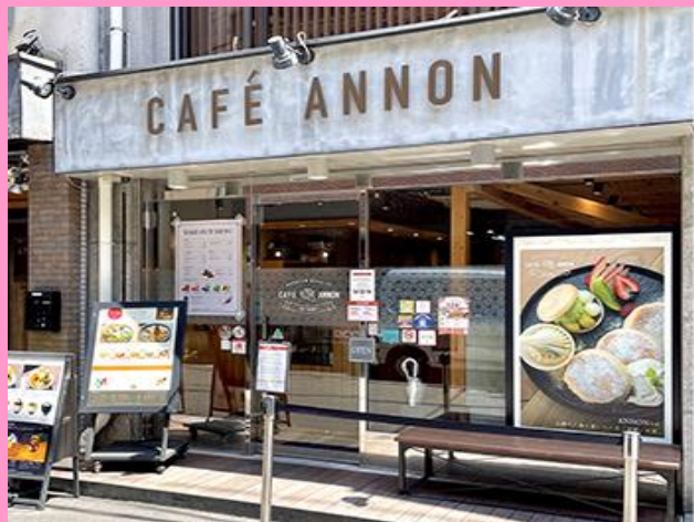
各線なんば駅から徒歩3分の好立地！