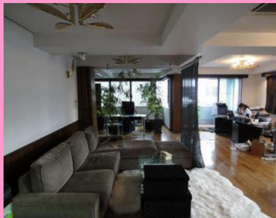
事務所です！とても綺麗でしょ(さくら)

☆訪問スタッフやご利用様と関わる中で、「自分も地域医療を支える一員なんだ」と実感出来る、温かみのあるお仕事です。