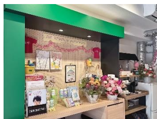
リラックスできる環境

お子さんの学校行事や急病時は、 お休みや早退で柔軟に対応できます。 複数メンバーで仕事を行うので、 スケジュール調整し家族旅行の計画も 立てられますよ！