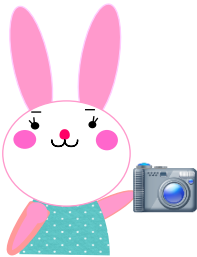
ハローワーク大阪東公認キャラクター 「イーストちゃん」