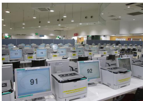
求人検索パソコン

求人検索パソコンで 事業所情報表示 をクリックすると、 画像情報 を見ることができます。