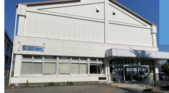
③大阪市浪速区 Aワーク創造館 1F