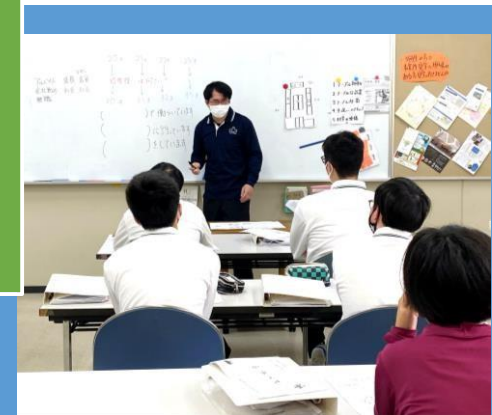
③L's College おおさか