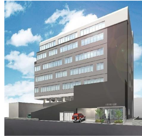
①②令和7年1月に移動予定（現建物の隣）