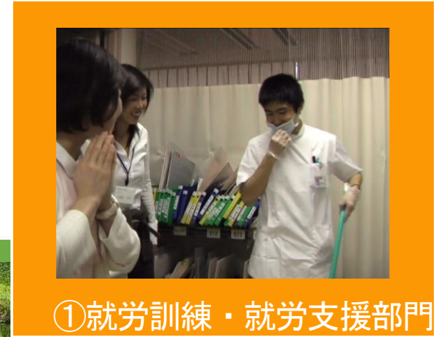
①就労訓練・就労支援部門