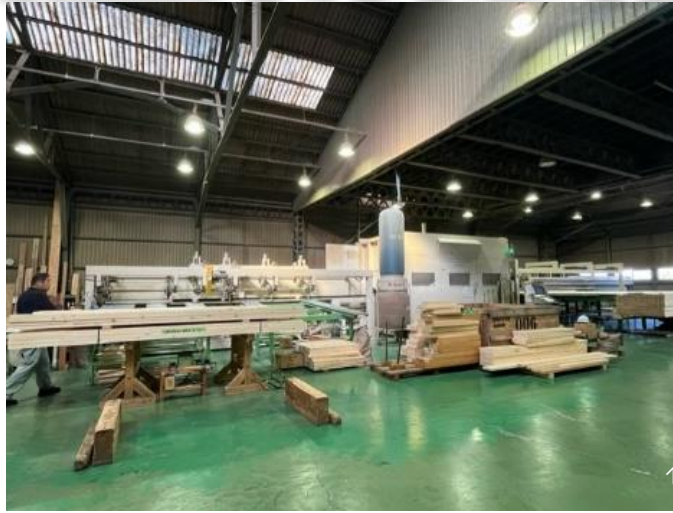
↑↑この大きな機械に入ると・・・