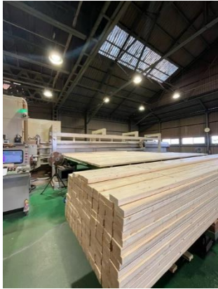
↑↑この木材を・・・