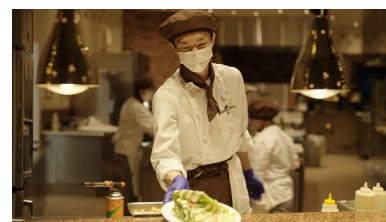
テーマパークシェフ 調理、衛生管理、 クルーの管理