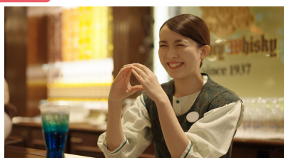
テーマパークフード 店舗リーダー レストランでの接客、時間帯責任者