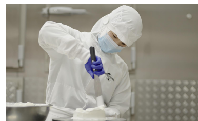
セントラルキッチン 専用施設での 料理の下ごしらえ