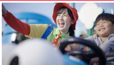
アトラクション ライド運営、ゲスト案内