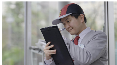
ゲートセキュリティ 従業員など入退場管理