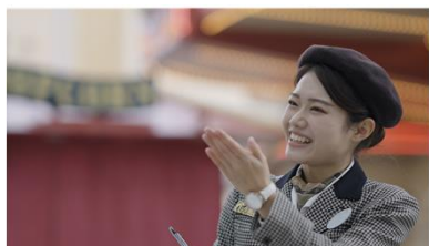
VIP エクスペリエンス ツアーガイド