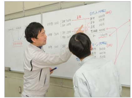
プロダクトサポート科

設計、金属加工、原価計算まで、ものづくりのトータル体験をします。CAD で設計し、レーザー、プレス加工などの金属加工で「ブックエンド」を作成し、最後にいくらかかるのか原価計算を行い、ものづくりを総合的に体験できます。