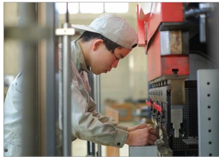
ものづくり金属科