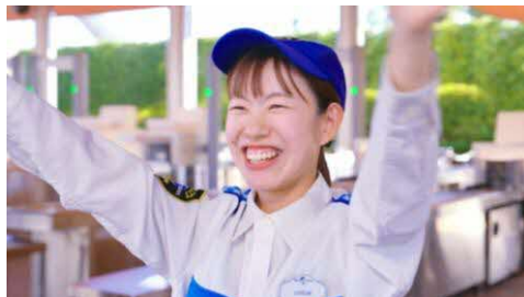
エントリーセキュリティ 手荷物の確認