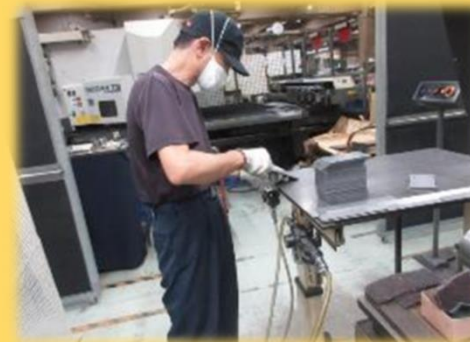
サンダー(やすり掛け)作業工程 (防塵マスク装着)