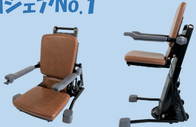
電動昇降座椅子「独立宣言」シリーズ