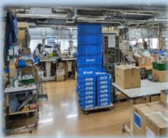
照明はオールLEDで、作業場全体が大変明るいです！