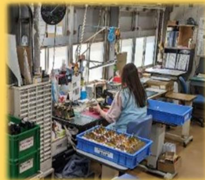
部品の組み立て工程