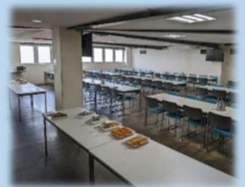
食堂は、全従業員が着席できる広さです！