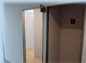
男女別々のトイレ&ロッカールーム(鍵付)を完備