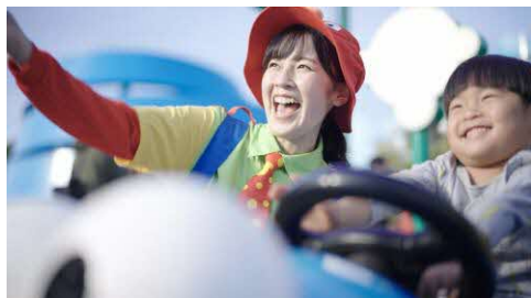
アトラクション ライド運営、ゲスト案内