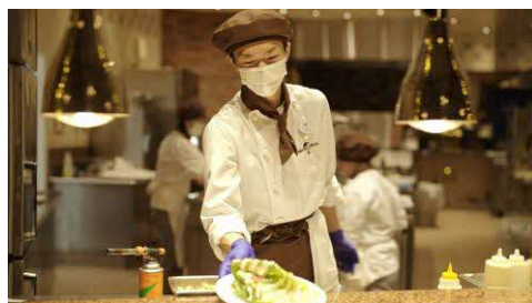
キッチン 調理、調理補助