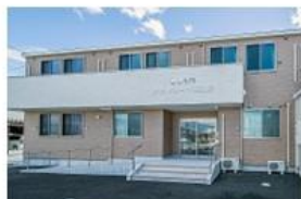
克蘭コート羽曳野