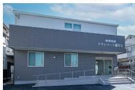
克蘭コート藤井寺