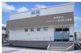
克蘭コート羽曳野 式番館