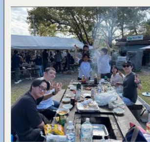
和気あいあいな 雰囲気です！