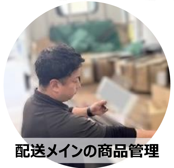
配送メインの商品管理

担当ルートのお客様への配送を担当しています。日々取引量や道路の状況が異なりますが、配送順等を考えて効率よくお届けできた時は達成感があります。多品種を扱うので覚えることも多く、慣れるまでに時間がかかりますが、先輩に聞きやすい雰囲気なので、自分のペースを作りながら安定して働けますよ。