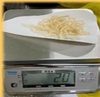
（計量作業・袋詰め作業の様子）