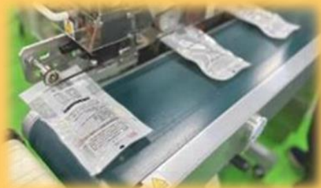
（パッケージング工程の一部）