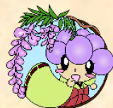
ハローワーク藤井寺 公式キャラクター ふ〜ちゃん