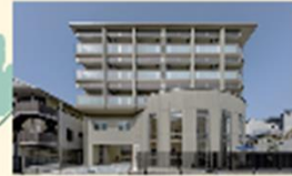
富永生活介護事業所