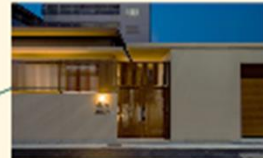
富永グループホーム