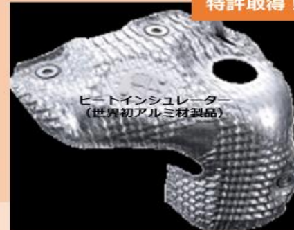
ヒートインシュレータ (世界初アルミ材製品)