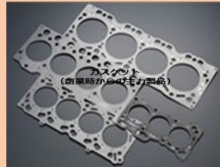
ガスケット (創業時からの主力製品)

ガスケット製造プレス作業・自動オペレーター/技術職(開発・設計)/海外課営業員/製品ピッキング、梱包、出荷作業/経理補助