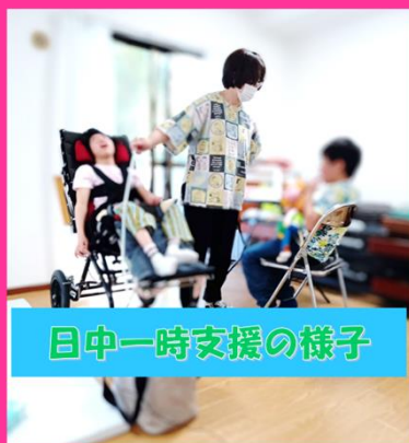
日中一時支援の様子

私たち居宅介護事業所ぱずるは、重度の障がいをお持ちの方々が、どんな状況でも自分らしく、豊かな人生を歩んでいけるようサポートしています。支援する側もともに成長できる、やりがいを感じられる職場環境です。「人の役に立ちたい」「誰かの生活を支援したい」という方は、私たちと一緒にその思いを形にしませんか？応募お待ちしております。