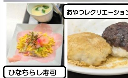
おやつレクリエーション