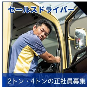
2トン・4トンの正社員募集

カンガルー便でおなじみの西濃運輸で、セールスドライバーの正社員募集。配属地域で、集荷と配達を行っていただきます。乗車するのは、街中でよく目にするはずのカンガルー便の4トントラック。普通免許（平成29年3月13日以降に取得された普通自動車免許でもOK。AT限定不可）をお持ちなら、未経験でも大歓迎ですよ！