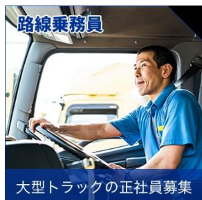
大型トラックの正社員募集

西濃運輸で大型ドライバーの正社員募集。ルート固定の定期便ですから、休日のシフトもしっかりしており、体の負担が小さく、生活のリズムが守れます。給与も仕事量も安定しますよ！安全走行を徹底するため、固定給に加えて通勤・残業・家族・住宅手当を支給。無理なく安定して稼ぐことが可能です。