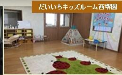
だいいちキッズルーム西堺園

今回のイベントや求人の詳細はこちらから ⇒ またはハローワークのお仕事探しの窓口でおたずねください