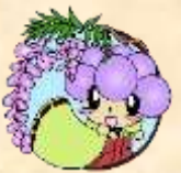
ハローワーク藤井寺 公式キャラクター ふ〜ちゃん