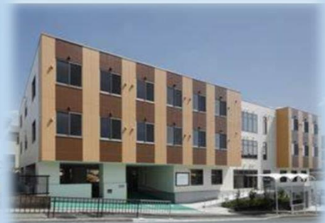
ナーシングホームなりた