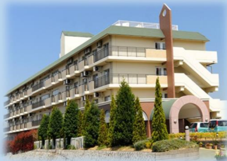
介護付有料老人ホーム ぽぷら

寝屋川市、枚方市を中心に、地域密着型で、薬局・介護サービス・NPOを展開している、創業47年を迎えた企業です。有料老人ホームや看護小規模多機能型居宅介護、ナーシングホーム、デイサービスなど、多様な施設あり。資格取得支援制度や、入社後の研修体制も充実。家庭との両立を目指す方も、安心して働ける環境を目指しています。