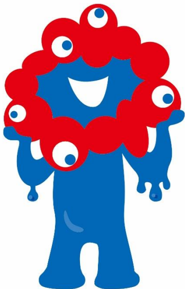
大阪・関西万博 公式キャラクター ミャクミャク