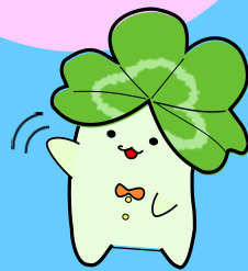
ハローワーク イメージキャラクター ハローパー