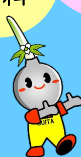
吹田市イメージキャラクター すいたん