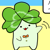
ハローワーク淀川イメージ キャラクター ハローパー