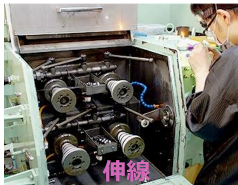
伸線 太い線材をダイヤモンド ダイスを使って細くする