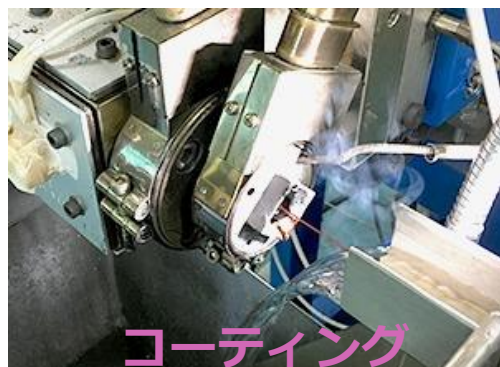
コーティング ワイヤの表面を仕上げる