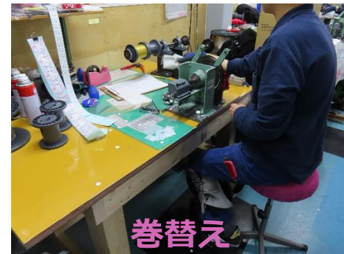
巻替え 手と目で検品しながら 指定の長さにする