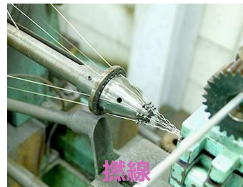
撚線 7本を撚り合わせて 1本の線にする