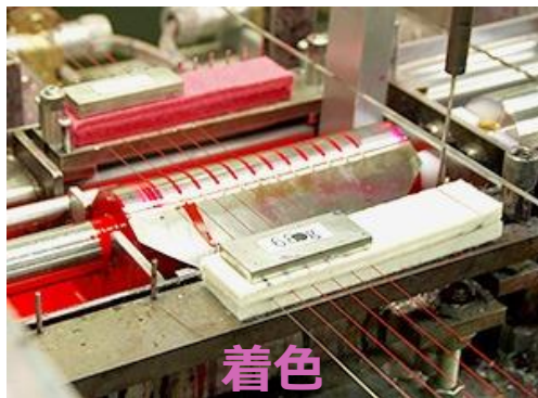
着色 エナメル系・ポリウレタン系 塗料を着色