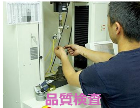
品質検査 強度や外径の測定等を 検査