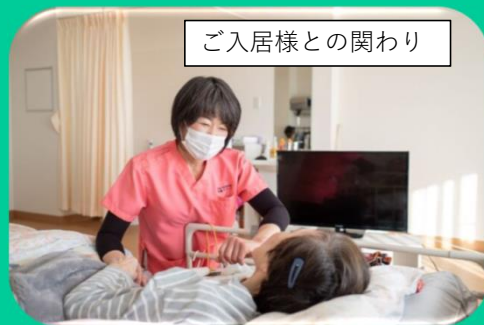
ご入居様との関わり