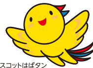
兵庫県マスコットはほたん

ミドル世代を積極的に正社員採用している兵庫県内の企業が参加する合同企業説明会を開催します。 経験者を求める求人から経験不問の求人まで、様々な業種の求人と出会うチャンスです。 新しい仕事にチャレンジしたい概ね35歳以上56歳以下の方の参加をお待ちしております。