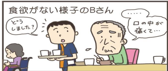
食欲がない様子のBさん