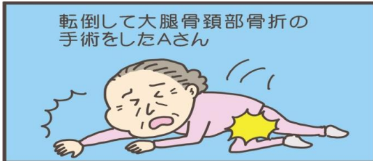
転倒して大腿骨頸部骨折の手術をしたAさん