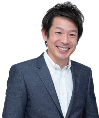
フリーアナウンサー 清水 健氏 (しみず けん)

在阪局夕方報道番組のメインキャスターを務め、現在はフリーアナウンサーとして活躍。各種司会・メディア出演・執筆活動の他、自身の経験を通じた講演会活動を行い、言葉にこだわり、伝え続ける清水健氏が、フリーアナウンサーへ転向した体験談、未来への踏み出し方についてお伝えします。