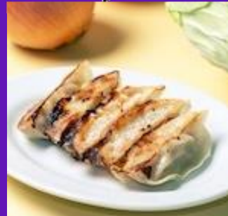
株式会社 ココロノート