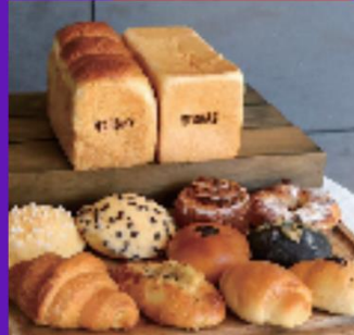
株式会社 GRACE TERRA