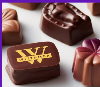
株式会社 エーデルワイス