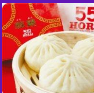
株式会社 蓬莱 株式会社 551 蓬莱