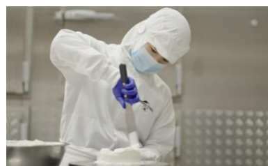
セントラルキッチン 専用施設での 料理の下ごしらえ