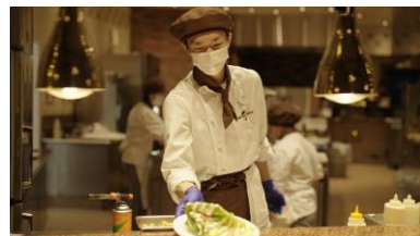
キッチン 調理、調理補助