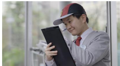
ゲートセキュリティ 従業員など入退場管理