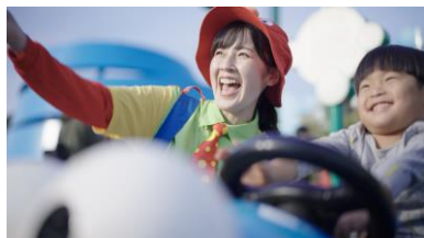
アトラクション ライド運営、ゲスト案内