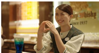
フードサービス レストランでの接客