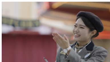
VIP エクスペリエンス ツアーガイド