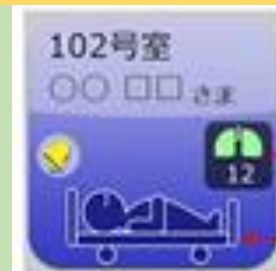
見守りシステムイメージ