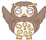
ハローワーク門真キャラクター ター かどまふくろう