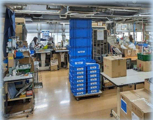
照明はLED。作業場全体が大変明るいです。