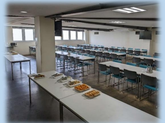
食堂は、全従業員が着席できる広さです。