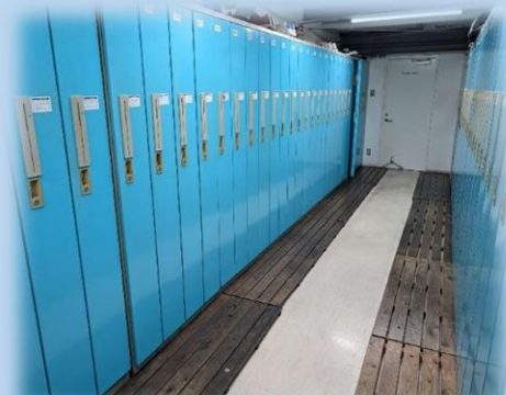
男女別々の鍵付きロッカー