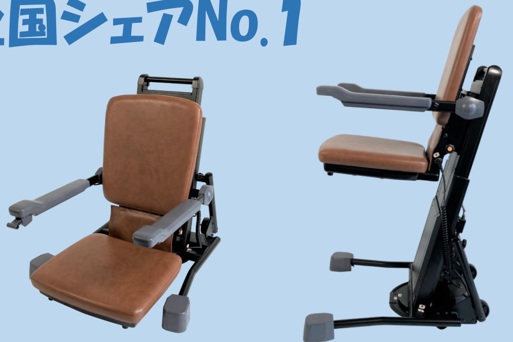
電動昇降座いす「独立宣言」シリーズ